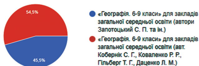
Рис. 1. Результати соціологічного опитування щодо попереднього вибору респондентами групи G модельної програми з географії

Опитування респондентів групи G проводилося в період з вересня 2022 р. по березень 2023 р. Воно було присвячене попередньому вибору модельної програми, яке продемонструвало, що наразі не спостерігається серед вчителів чіткого домінування у виборі однієї