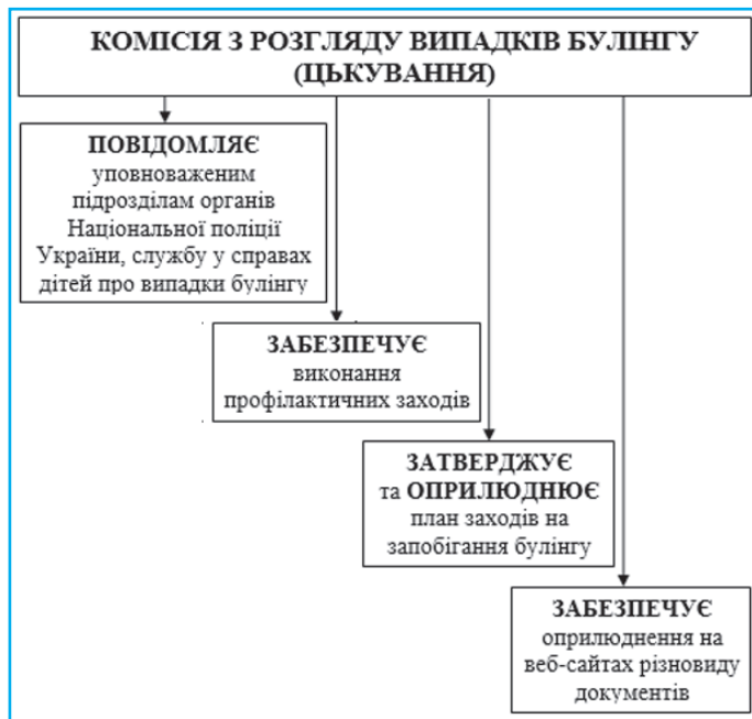
Рис. 3. Робота комісії з розгляду випадків булінгу (цькування)

Таким чином, зробимо висновок щодо роботи комісії з розгляду випадків булінгу (цькування) за допомогою рисунка 3.