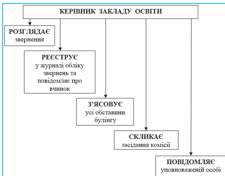
Рис. 2. Розслідування фактів булінгу керівником закладу освіти

Таким чином, узагальнимо розслідування фактів булінгу керівником закладу освіти за допомогою рисунка 2.