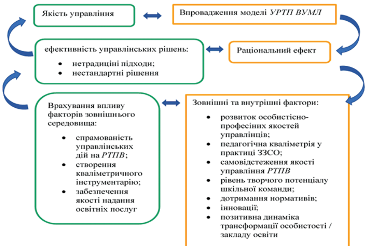
Рис. 3. Основні фактори ефективності функціонування закладу освіти

Це є тим, що ми називаємо рефлексивним виходом, коли нова позиція діяча, що характеризується відносно його минулої позиції, буде називатися «рефлексивною позицією». Щодо отриманих знань, які були вироблені в ній, то будуть «рефлексивними знаннями», оскільки вони беруться відносно знань, вироблених у першій позиції. Тож рівень ТПВ залежить від умов та внутрішніх і зовнішніх факторів, а ефективність управлінських рішень – від якості управління особистості зі всебічним розвитком. Тому, впроваджуючи модель управління, – забезпечуємо ефективність управління шляхом цілеспрямованого процесу самовдосконалення керівника, підвищення рівня його особистого ТП та шкільної команди, професійної компетентності, якості надання освітніх послуг і розвитку закладу (рис. 3):