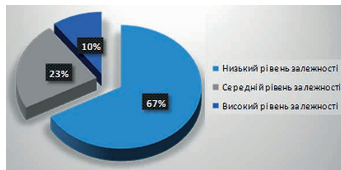
Рис.1. Результати діагностики за методикою «Тест Інтернет-залежності» К. Янга

Виклад основного матеріалу. На початковому етапі було розроблено програму та методику емпіричного дослідження. Другий етап – це проведення самого емпіричного дослідження. Було проведено пілотне дослідження з метою емпіричної розвідки на базі Дніпропетровського національного університету імені Олеся Гончара. У дослідженні брали участь студенти другого курсу, 30 осіб від 17 до 21 року, 15 осіб чоловічої статі та 15 – жіночої статі. Саме така вибірка підходить для дослідження, тому що відповідає вимогам мети та визначеним завданням. Для з'ясування рівня соціально-психологічної адаптації та особистісних характеристик під час та після війни, вибір зупинився на таких методиках: 1) «Тест Інтернет-залежності» К. Янга; 2) опитувальник «Методика діагностики схильності до різних залежностей» (Г. Лозова). На третьому етапі здійснено обробку експериментальних даних та їх аналіз.