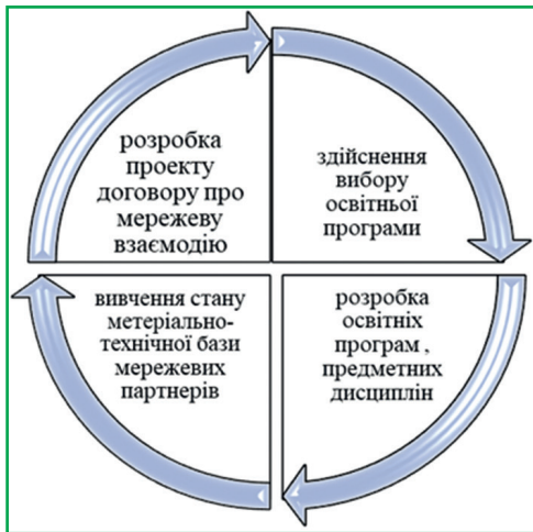
Рис. 2. Поетапний процес підготовки до мережевої взаємодії.

загальної освітньої програми до підписання договору про мережеву співпрацю.